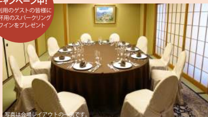
写真は会場レイアウトの一例です。

ご家族や少人数のお仲間のご利用に最適！ のんびりと過ごす、アットホームなパーティー