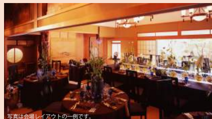
写真は会場レイアウトの一例です。